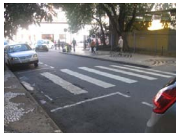
Fig. 8 Ausência de rampa em travessias