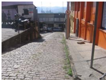
Fig. 4 Topografia acentuada na região central