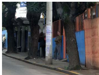
Fig. 7 Localização do mobiliário urbano