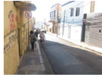
Fig. 3 Largura das calçadas na região central