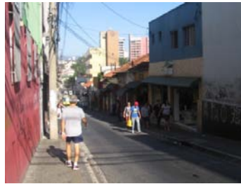
Fig. 2 Largura das calçadas na região central