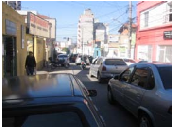
Fig. 1 Congestionamento na área central

A questão do congestionamento , entretanto, demonstrou prioridade absoluta no ponto de vista da população, enquanto para os especialistas o tema fluidez e circulação obteve outra posição no ranking. As figuras 1 a 9 apresentam alguns problemas de mobilidade identificados pelos especialistas e pela população em Jundiá.