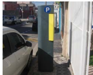
Fig. 5 Localização do mobiliário urbano