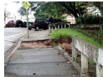
Fig. 6 Problemas de manutenção da calçada